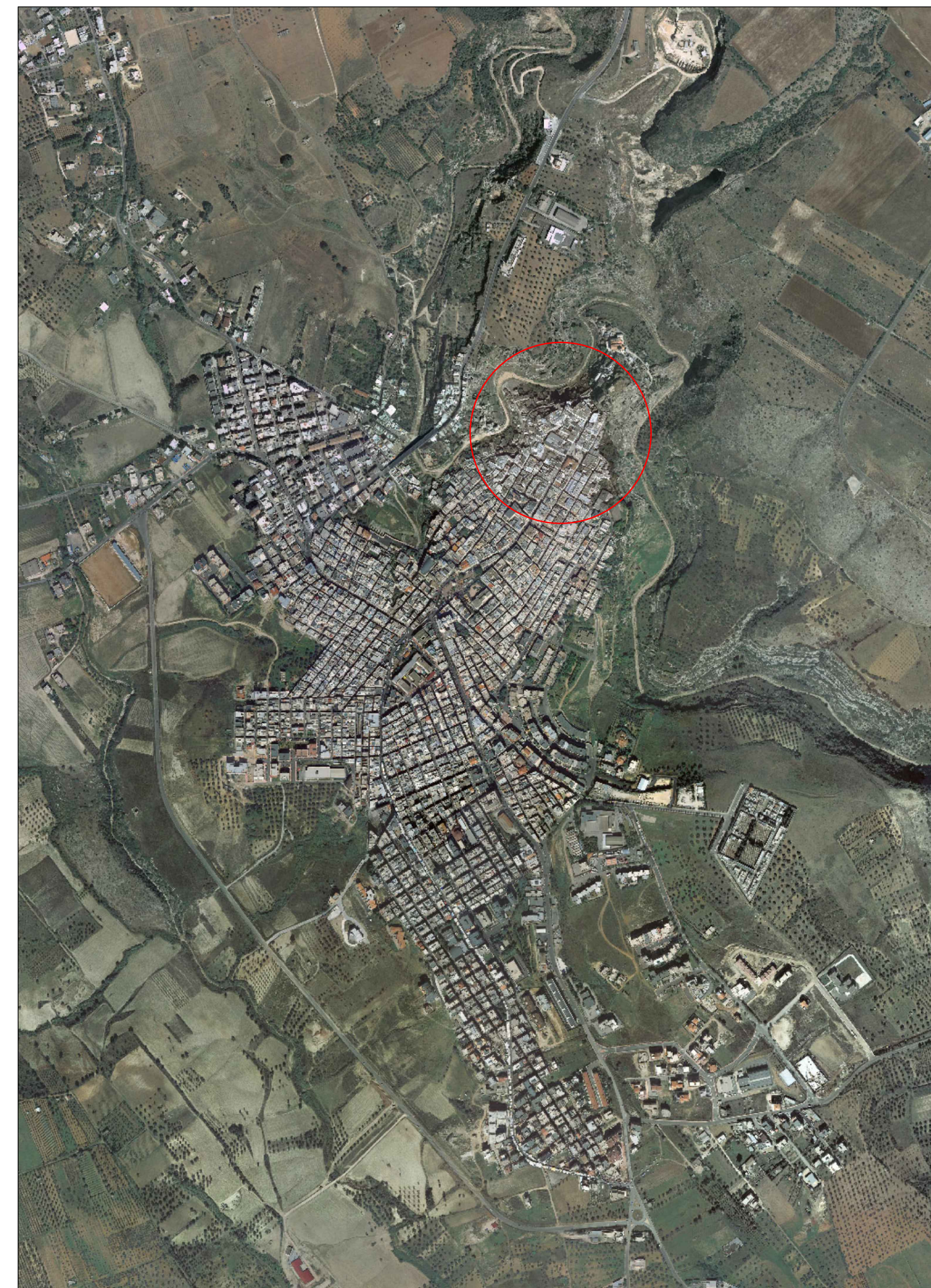
ORTOFOTO scala 1_10000