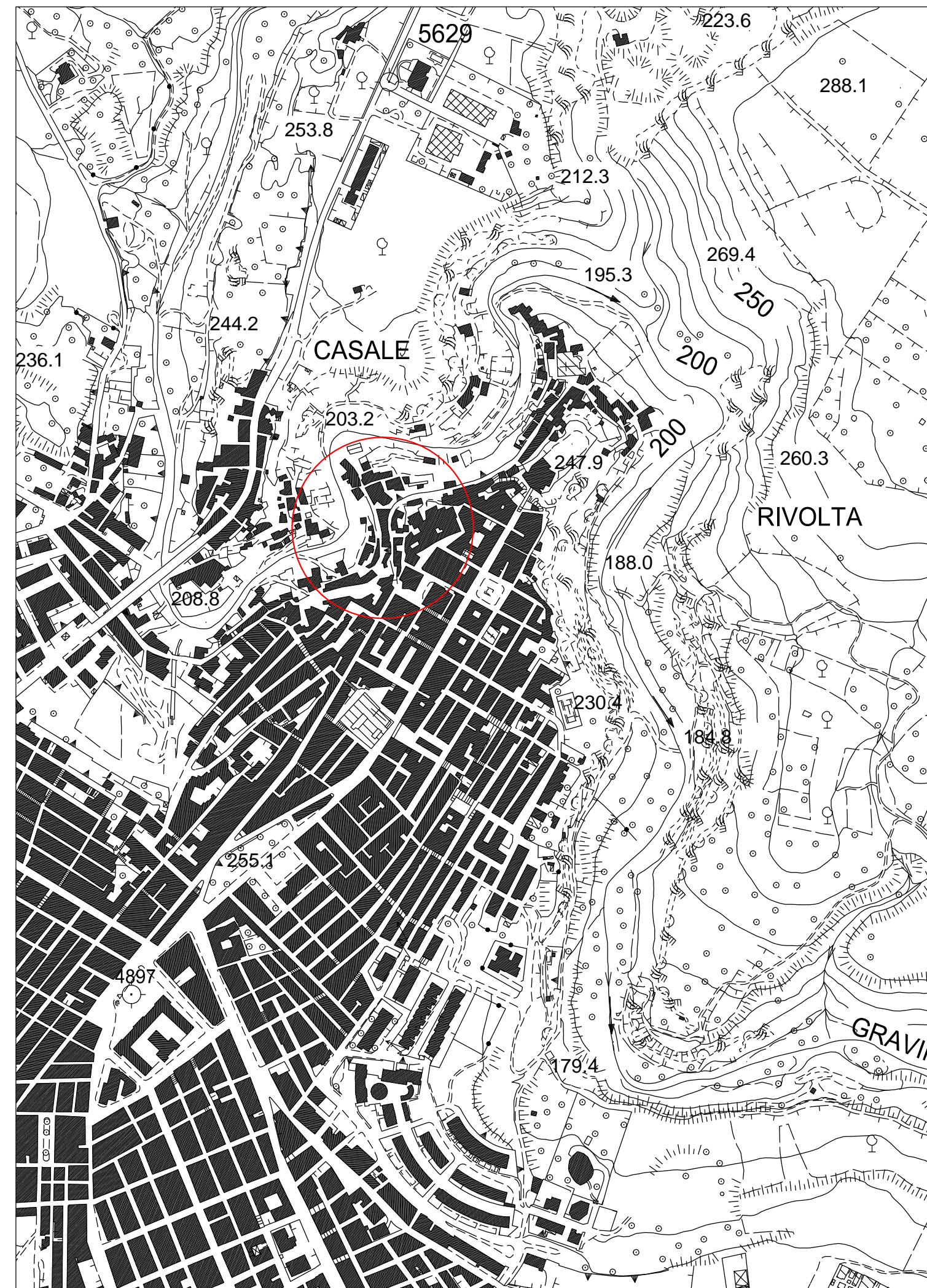
STRALCIO DI AEROFOTOGRAMMETRICO scala 1_5000