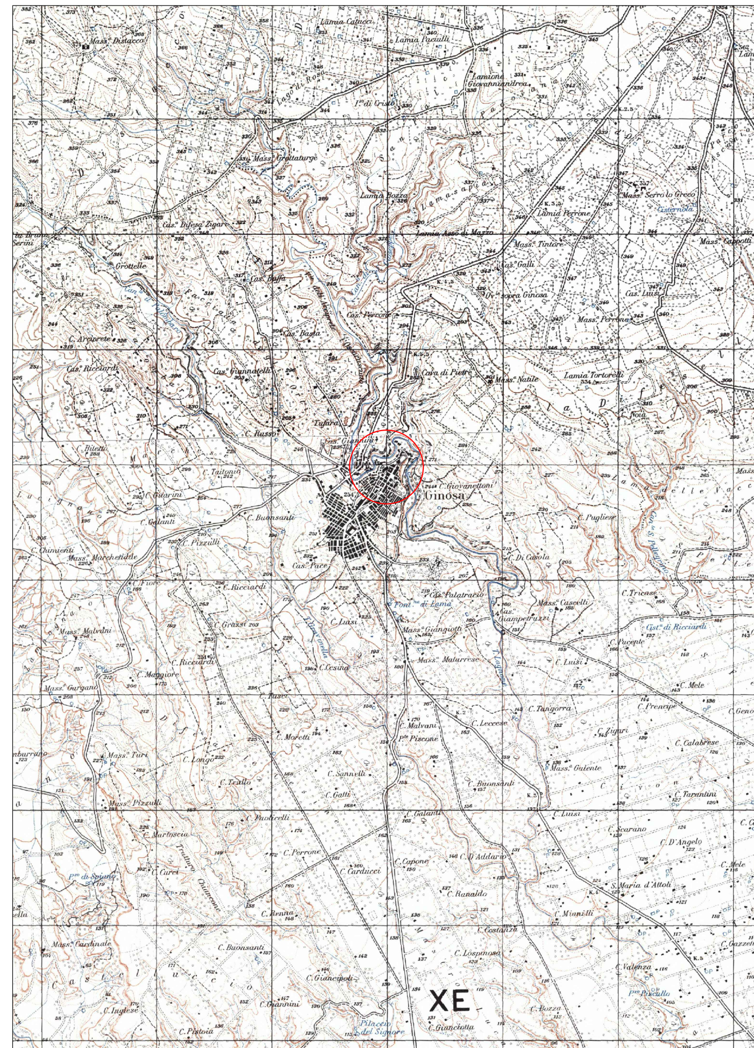
I.G.M. scala 1_25000